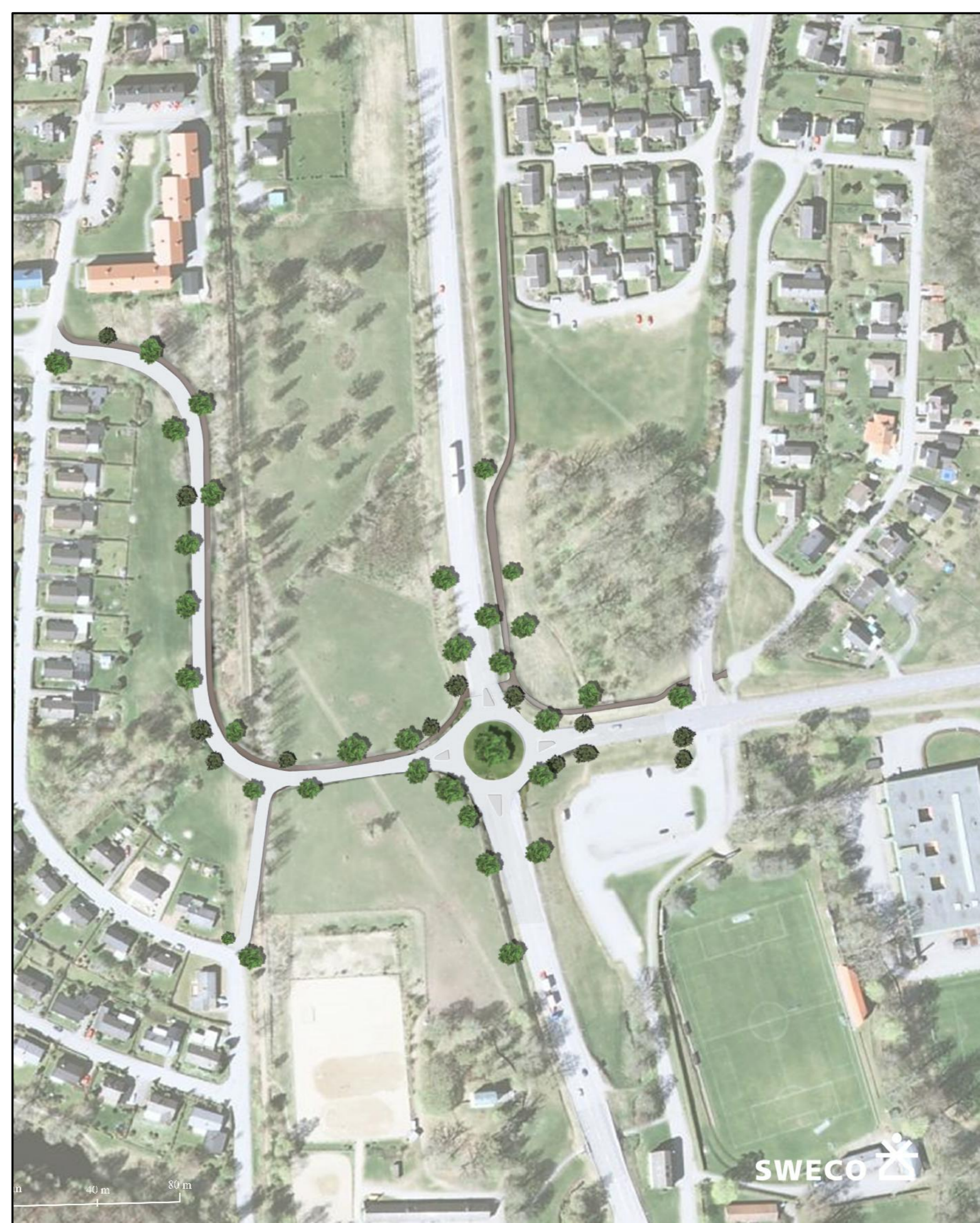
Illustrationsplan över södra cirkulationsplatsen